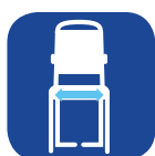
Largura do assento ▼

Para informações de pré-venda mais completas sobre este produto, incluindo o manual do utilizador do produto, consulte o website da Invacare.