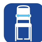
Largura entre apoios de braços ▼