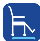
Profundidade total ▼