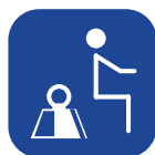
Peso máximo do utilizador ▼