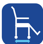
Profundidade do assento ▼