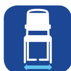
Largura total ▼