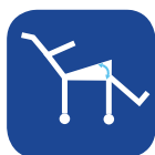
Ângulo de basculação ▼